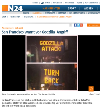
Abbildung: [N24.de, 18. Mai 2014]